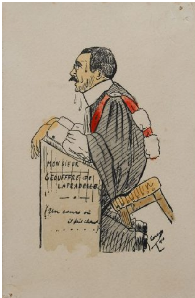
Portraits de professeurs