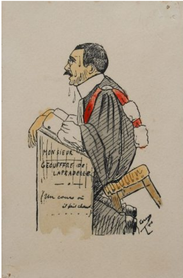
Portraits de professeurs